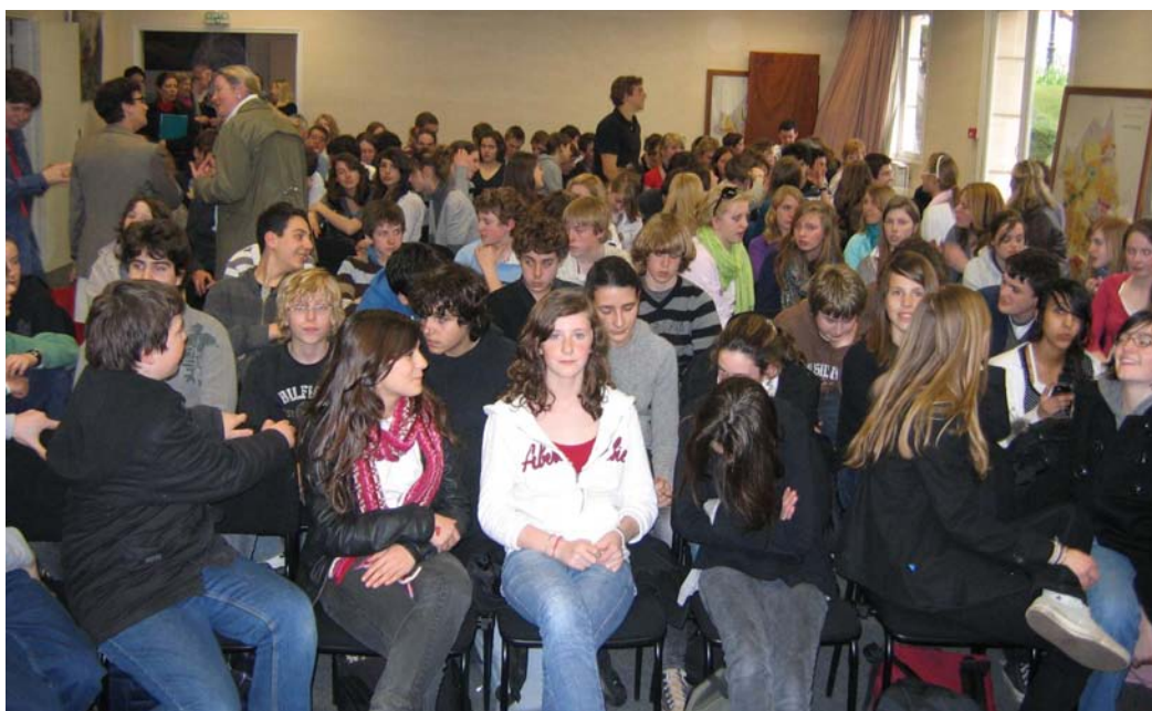
Les élèves étrangers et leurs correspondants attendent avec impatience le discours de Monsieur le Maire et les viennoiseries.